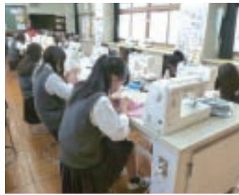
ファッション造形基礎(1,2年)