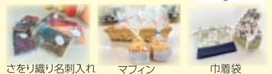
さをり織り名刺入れ