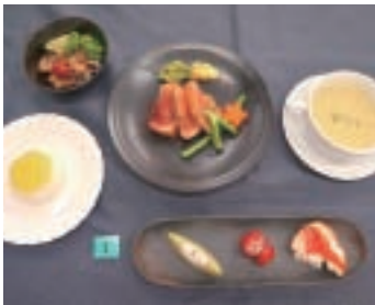
食物調理技術検定 1級