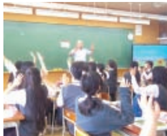
コミュニケーション講座