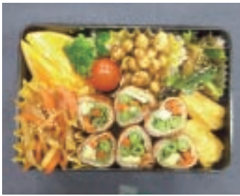
食物調理技術検定 2級

家政科では、調理・被服・保育・福祉等の専門科目を学びます。 将来のスペシャリストを目指して、専門分野で活躍できる能力を育成し、多様な進路に対応します。