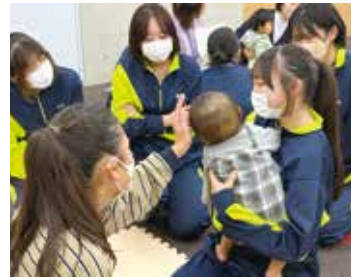
ライフデザインセミナー(2年)