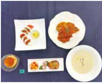
食物調理技術検定1級

家政科では、調理・被服・保育・福祉等の専門科目を学びます。 将来のスペシャリストを目指して、専門分野で活躍できる能力を育成し、多様な進路に対応します。