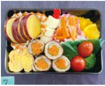
食物調理技術検定1級