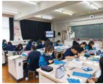
被服製作技術検定3級(1年)