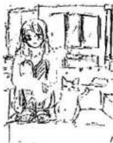
植村 香苗 14 千葉県柏市

高校生 長野 西 16 (埼玉県越谷市) 母の日に何を贈ろうかなと考えた。昨年は好物の和菓子にしたが、今年は新型コロナで置い物がしにくい。家にいてできることは何だろう。幼い頃は阿たなき券を作ってあげたが、もう高校生だ。 思案した結果、今年は手作りマスクにした。家族のために危険を冒して買い物に行ってくれる母のためだ。母の好きな薄桃色の布を選び、ミシンを走らせた。とても喜んでくれた。