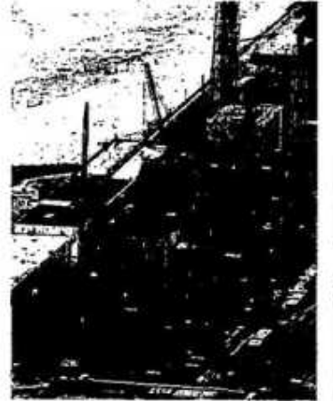
▲ 福井作業者が歩く福島県一原発電所。2011年9月、本社機から撮影

社会的危機の中で意識されやすい直接的なリスクよりも間接的なリスクのほうが実は人命を奪っていた、という事例は歴史上、枚挙に暇がない。例えば、フーレンス・ナイチンゲールはクリミア戦争の際、戦死者の死因が戦傷で受けた傷そのものではなく治療現場の不衛生にあることを統計的に明かし、手洗い等