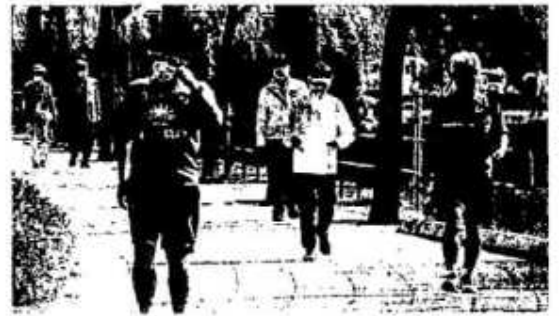
感染対策をしたうえで散歩し、歩数を増やすのも有効だ

トップアスリートのまねはできなくても数分、数十秒の積み重ねなら何とか続けられそう。