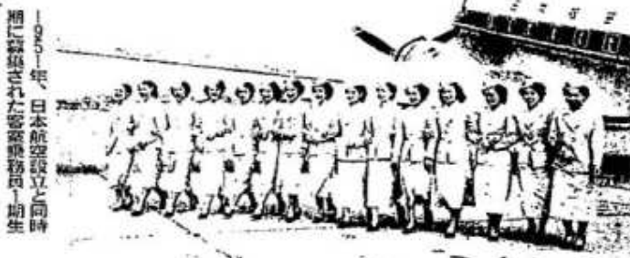
1957年、日本航空設立と同時に撮影された客室乗務員1期生

「CA（シー・エー）」と呼ばれる、日本の航空会社の客室乗務員。その存在にどんなイメージが付与されてきたのかを考察する『客室乗務員の誕生』（岩波新書）が刊行された。著者で独協大教授の山口誠氏は「客室乗務員を見ることで、日本社会のあり方も考えられる」と話している。