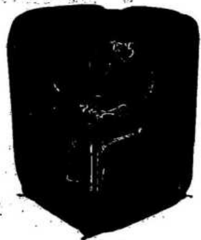
「プライバシーテント」の使用イメージ